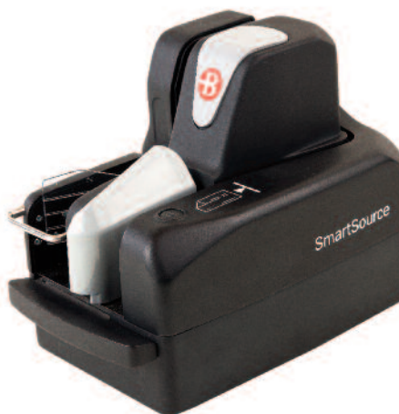
SmartSource Professional Elite