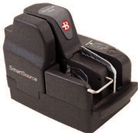
SmartSource Merchant Elite

Sua solução para a captura remota de depósitos